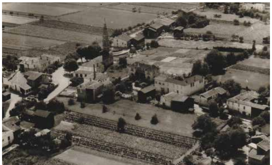
Barie en 1968

Ceci va contribuer à préserver notre bel environnement et obtenir à terme une labellisation de territoire engagé pour la nature, comme souhaité par la municipalité.