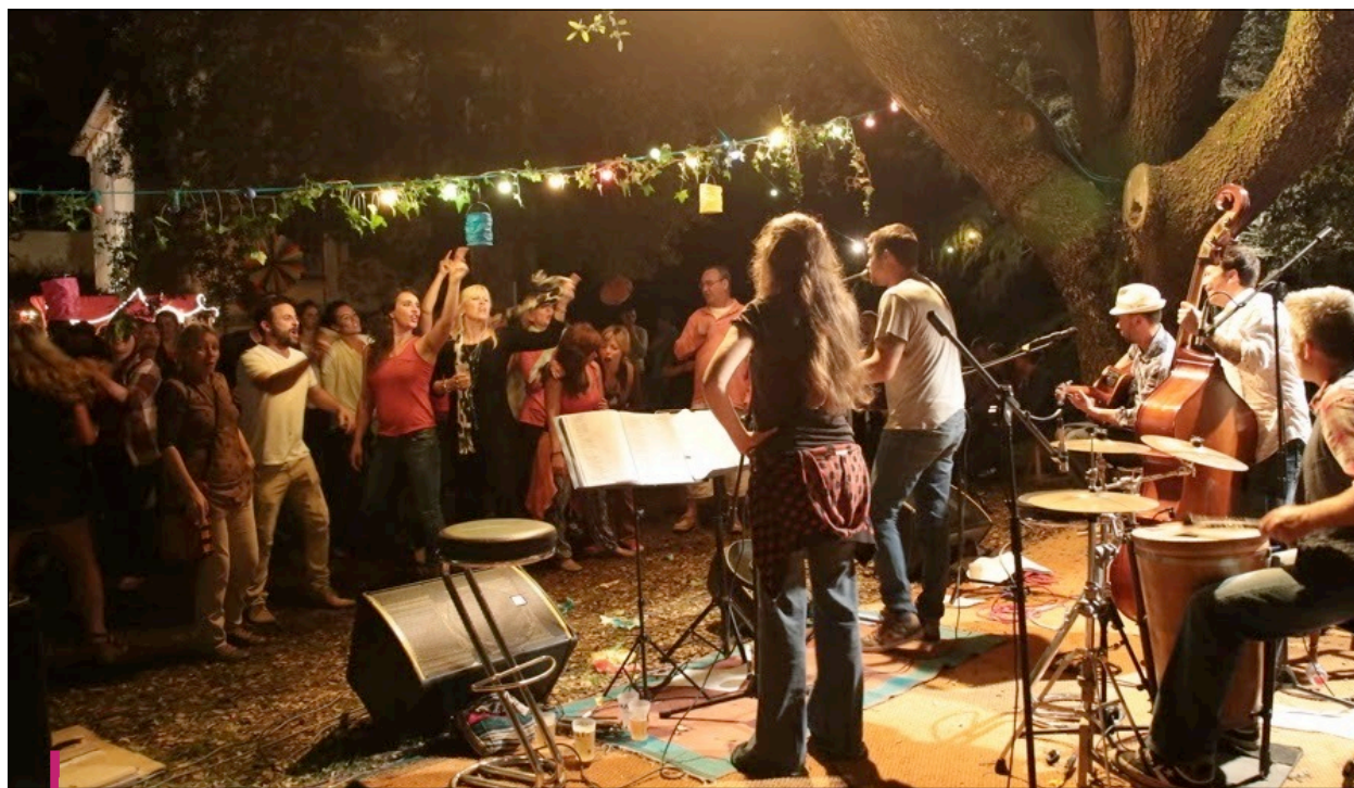
Le concert Barie Olé 2015 avait réuni plus de 300 spectateurs sous le chêne vert entre église et mairie.

L es BariOlés ne sont décidément pas vernis avec la météo. La plupart des rendez-vous qu'ils ont organisés depuis leur création il y a deux ans ont peu ou prou été menacés par la pluie. En avril dernier, leur festival des Epouvantails s'est fort bien déroulé, mais dans la grisaille entre deux jours de plein soleil. Pour leur concert du 10 juin, ce fut pire ! D'abord avec la chute d'une énorme branche du chêne vert sous lequel était prévue la fête, ce qui les a obligés à prévoir un transfert sur la place de l'église, puis avec une météo tellement menaçante qu'ils ont finalement annulé, la mort dans l'âme. Histoire de conjurer le sort, l'association a décidé de ne pas attendre juin prochain pour reprogrammer ce concert qui s'annonçait très prometteur. Ils donnent donc rendez-vous au public sud-girondin - et au-delà - le samedi 17 septembre prochain. Toujours avec deux groupes à l'af-