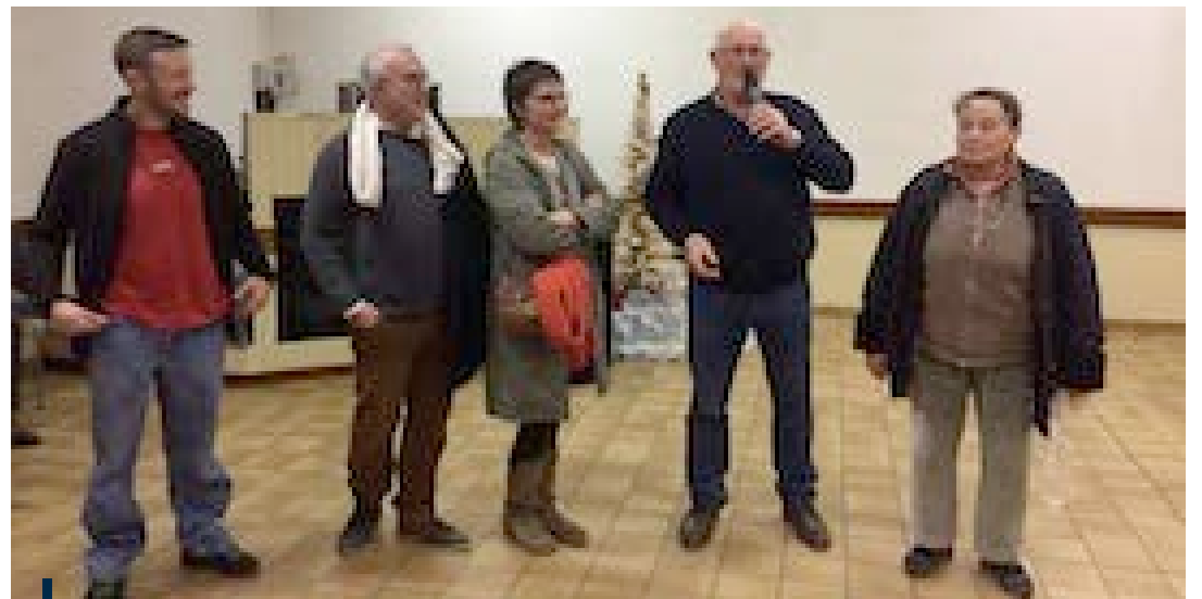
Les Voeux ont permis d'accueillir les nouveaux Bariots

Fin janvier, pour les voeux, le Maire de Barie est revenu sur la nécessité, pour tous les habitants du village, de respecter quelques règles élémentaires relatives aux chiens en liberté, à la taille des végétaux empiétant sur la voie publique ou à la déclaration obligatoire des travaux sur les habitations au nom de l'équité entre tous les contribuables.