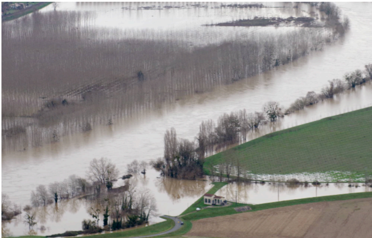
Le secteur de Trempe-Soupe

Son utilisation, tant lors de l'exercice de novembre que de l'inondation de décembre, a globalement donné satisfaction tout en nécessitant tou-