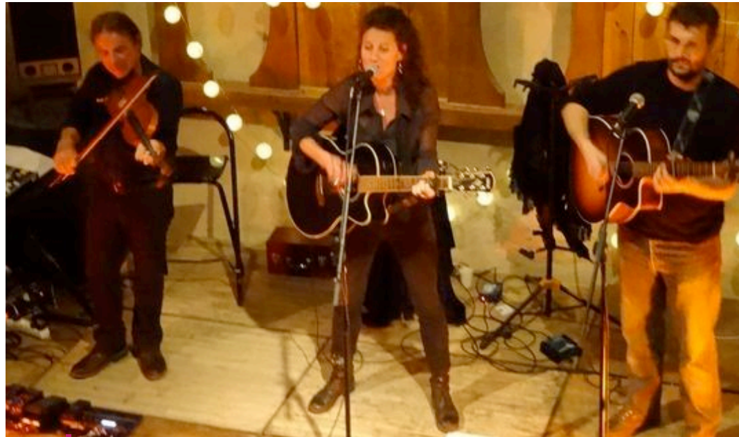
La Fiancée du Pirate

P lace d'abord aux arts plastiques et à la «Faites des épouvantails» dont ce sera cette année la 3e édition puisque ce joyeux moment de délire artistique ouvert à tous alterne une année sur deux entre épouvantails et autre applications (les brouettes en 2017 et les vélos en 2019 lors de la fête du village). La recette est toujours la même : une après-midi (ré)créative sur la place du village, à l'abri des intempéries sous les barnums de la CdC du Réolais en Sud-Gironde, le sacre de la plus belle œuvre vers 18h, puis un repas partagé sur réservation (1) et en musique. Pour danser cette année, c'est la Fiancée du Pirate qui donnera le rythme avec des chansons qui témoignent fortement de l'histoire maritime et fluviale, mais expriment aussi des revendications sociales, les espoirs et les peines de ceux qui furent à la base de notre société moderne. De ritournelles traditionnelles en chants de pirates, de chants de travail en chants de tavernes, l'équipage, armé jusqu'aux dents d'instruments acoustiques, plon-